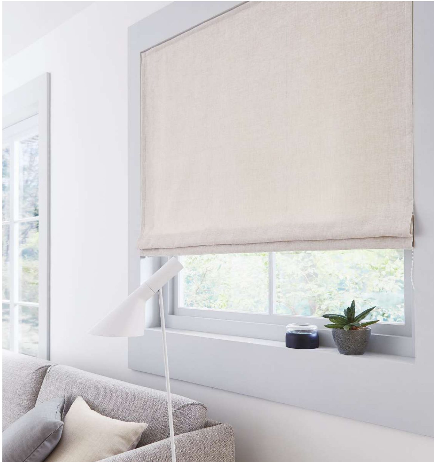
ブレースェード：AC2271 クッション：AC2309(P.139)、AC2025(P.19)

シェニール系使用のやわらかな多色シリーズ。 高級感のある質感がワンランク上の空間を演出します。