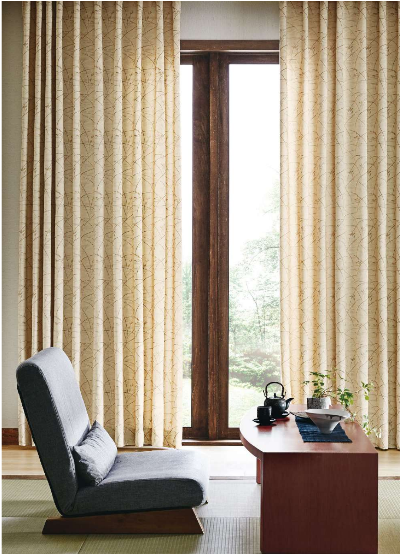
ドレープ LP : AC2267

※生地製の製法上、縫製時に柄が合わない場合があります。 ※糸が滑りやすい組織のため、目寄せが起きやすいのでお取り扱いにご注意ください。