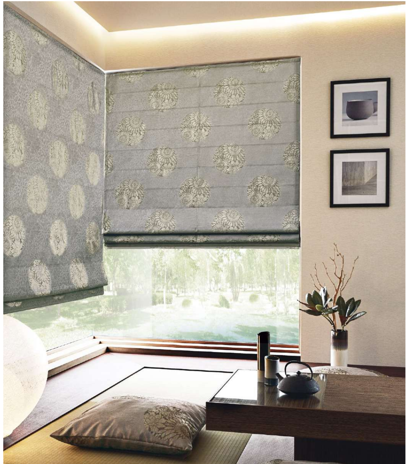
シャープシェード：AC2258 クッション：AC2259