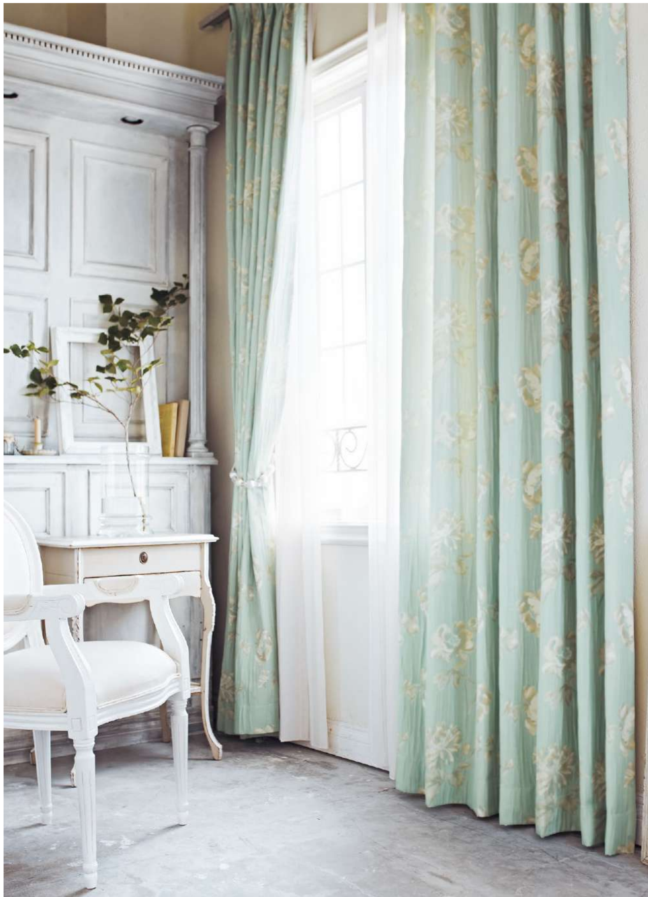
ドレープ LP: AC2222 シアー: AC2541 裾ウーリー(P.228)

※二重組織のため、プリーツ部分のしわやふくらみが目立つことがあります。 ※生地は製法上、縫製時に柄が合わない場合があります。