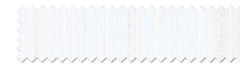
マッチシアー: AC2610 (P.261)