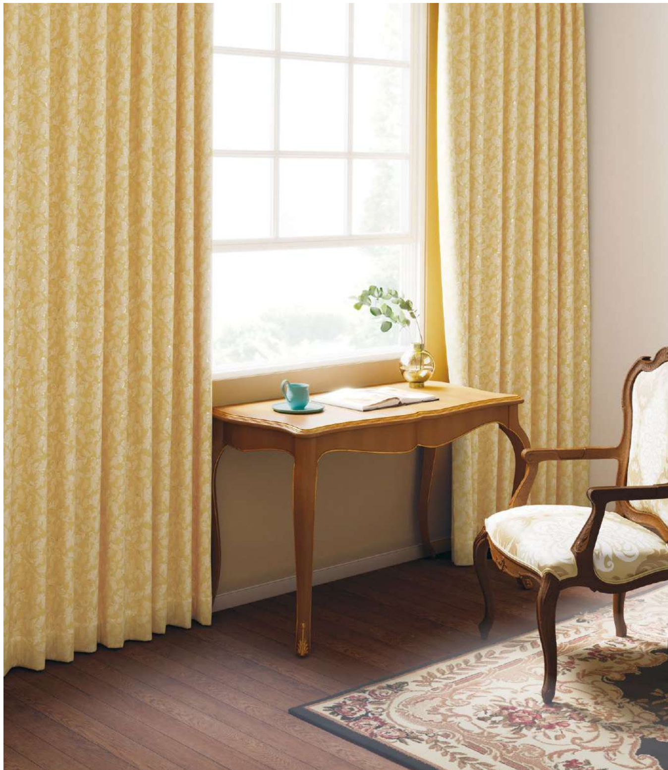
ドレープ LP : AC2208