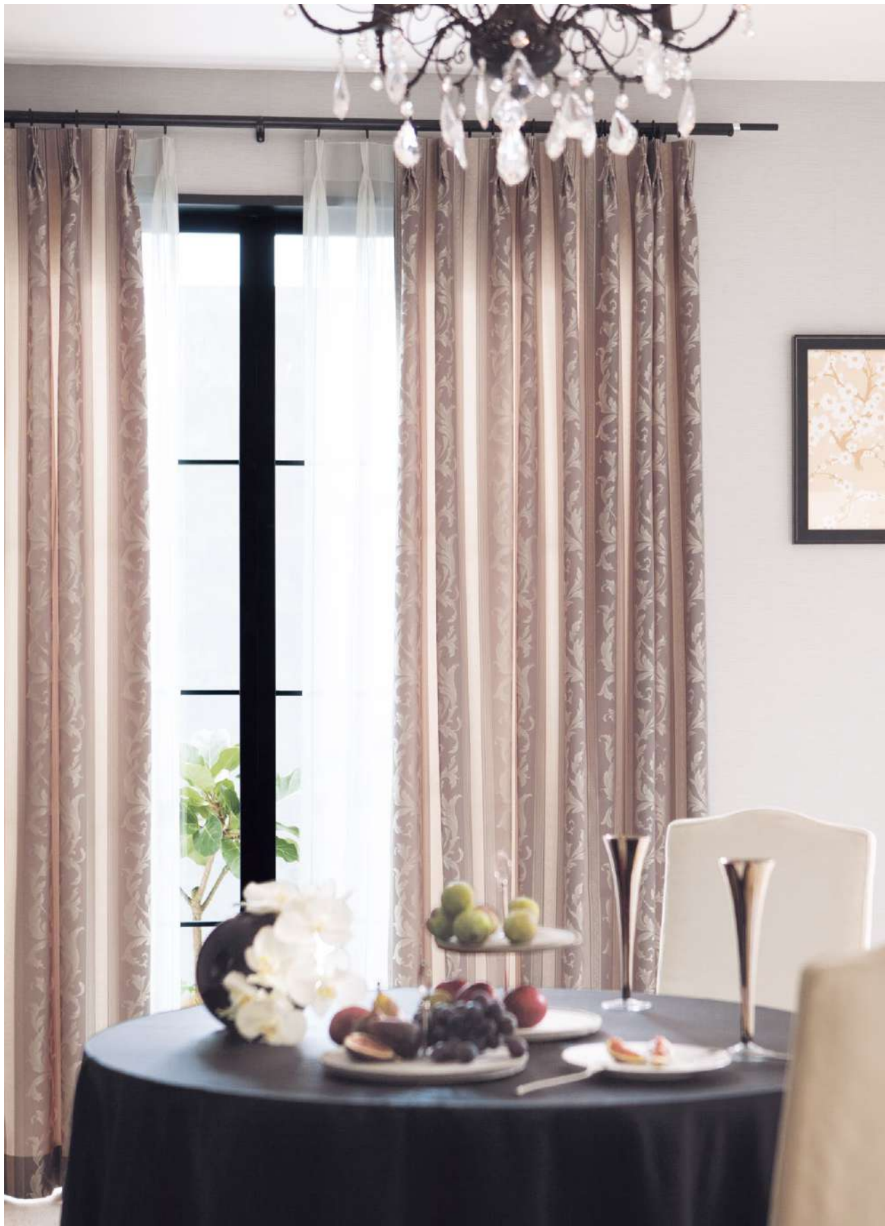
ドレープ LP (ヒダ柄取り縫製) : AC2207 シアー : AC2541 裾ウーリー (P.228)