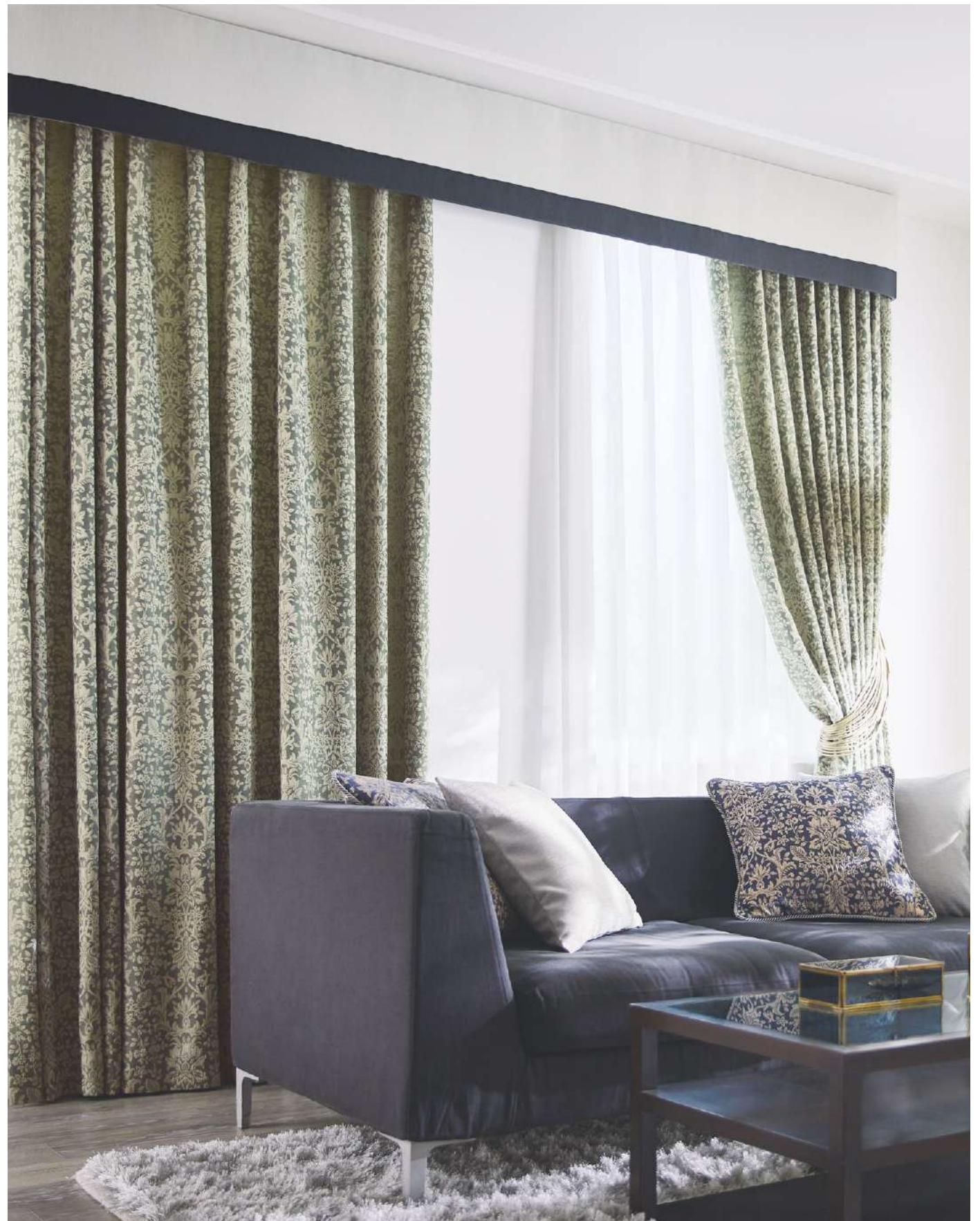
ドレープ LP：AC2194 シア- AC2564(P.237) ストレートフラットバランス(ボーダー付 ボトム型)：AC2421・AC2420(P.174 QR参照) パイピングクッション：AC2195・FN1189 クッション：AC2319(P.142)