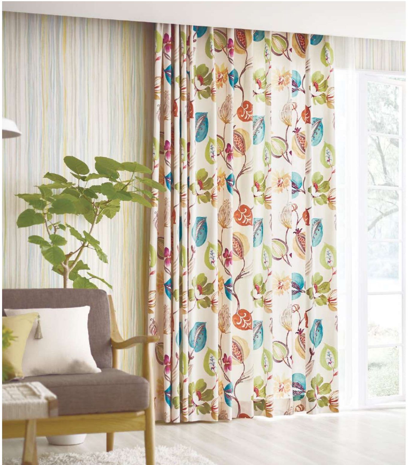
ドレープ：AC2172 シアー：BF4976 裾ウーリー(2021 EDA) キータッセル付クッション：BF4956(2021 EDA)・FN1153 クッション：AC2300(P.138) 壁紙：BW4843(2021 EDA)