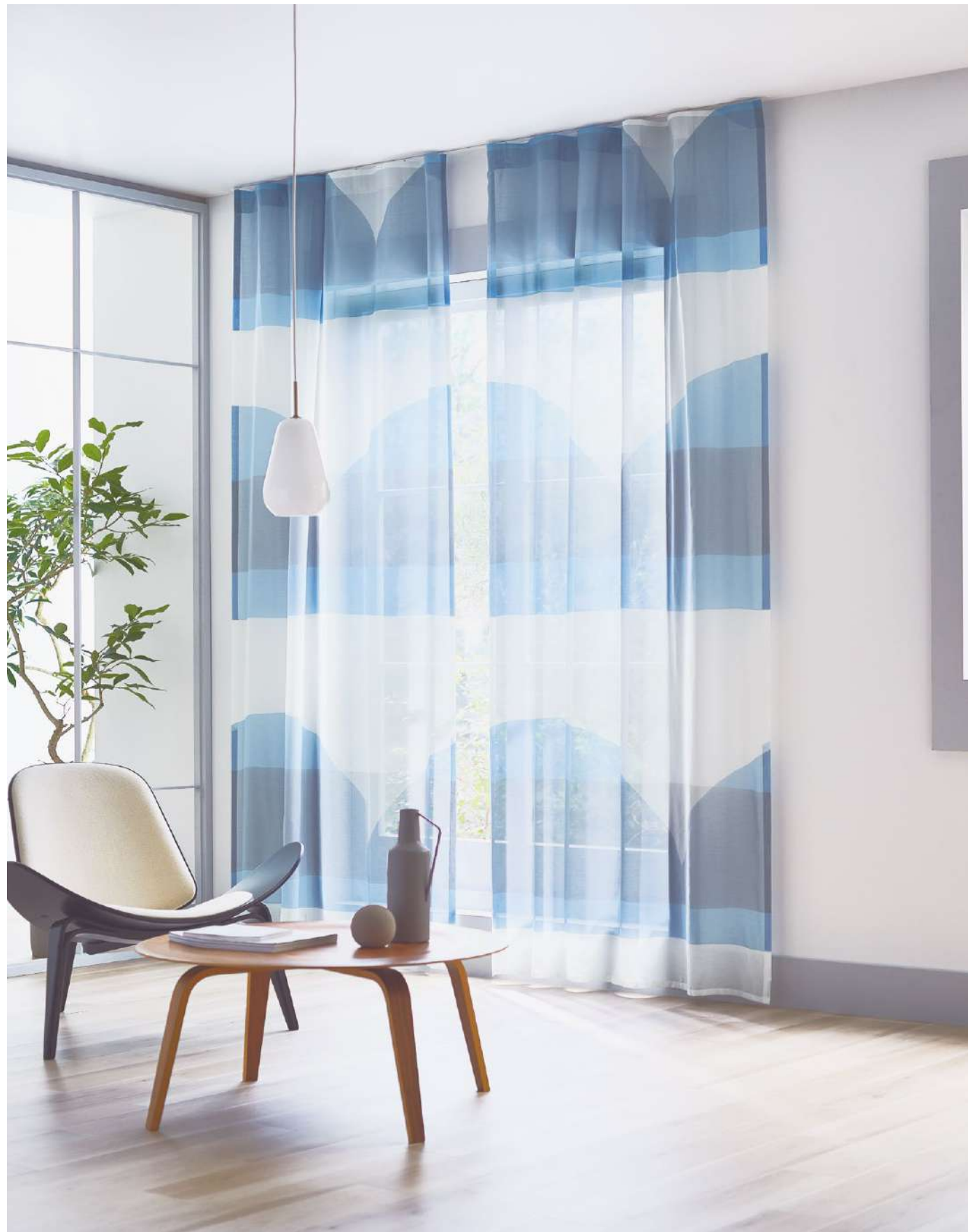
フラットカーテン(1.3倍) : AC2131 裾2.5cmダブル折返し

※生地製の製法上、縫製時に柄が合わない場合があります。 ※生地製の特性上、糸の節が目立つことがあります。