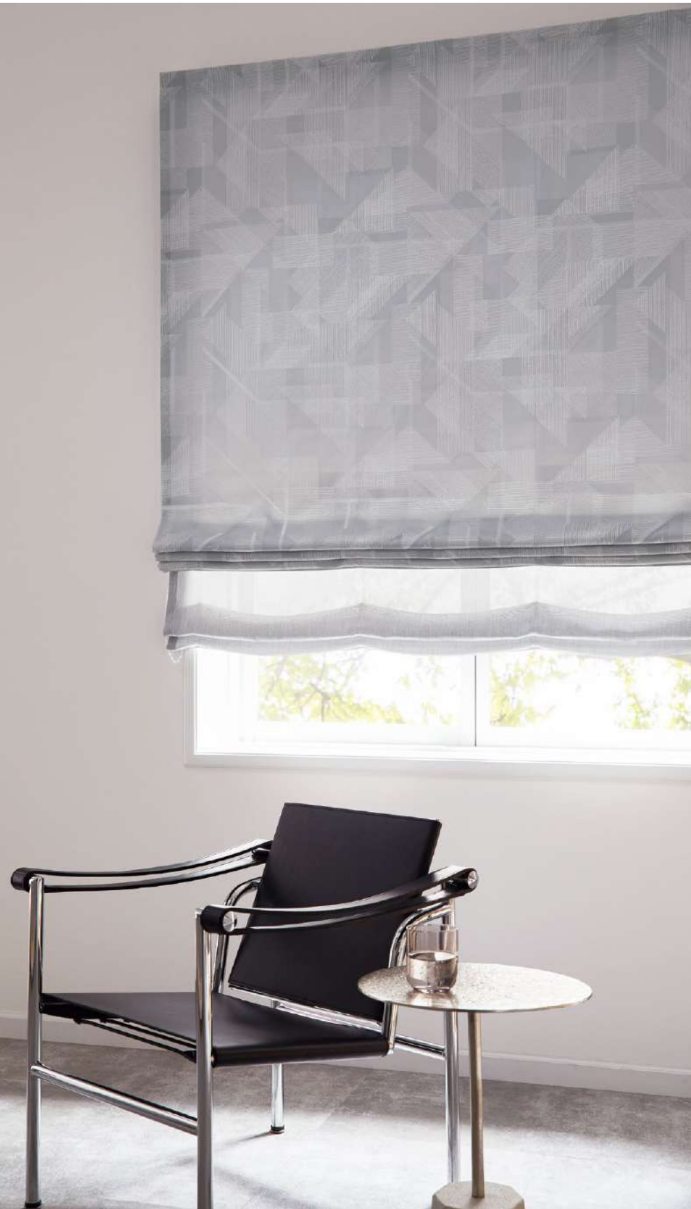
ツインシェード(プレーン+プレーン) : (前幕)AC2081 (後幕)AC2588(P.247)

※二重組織のため、フリーズ部分のしわやふくらみが目立つことがあります。 ※生地の製法上、縫製時に柄が合わない場合があります。 ※生地の製法上、表面の引きつれや糸切れにご注意ください。