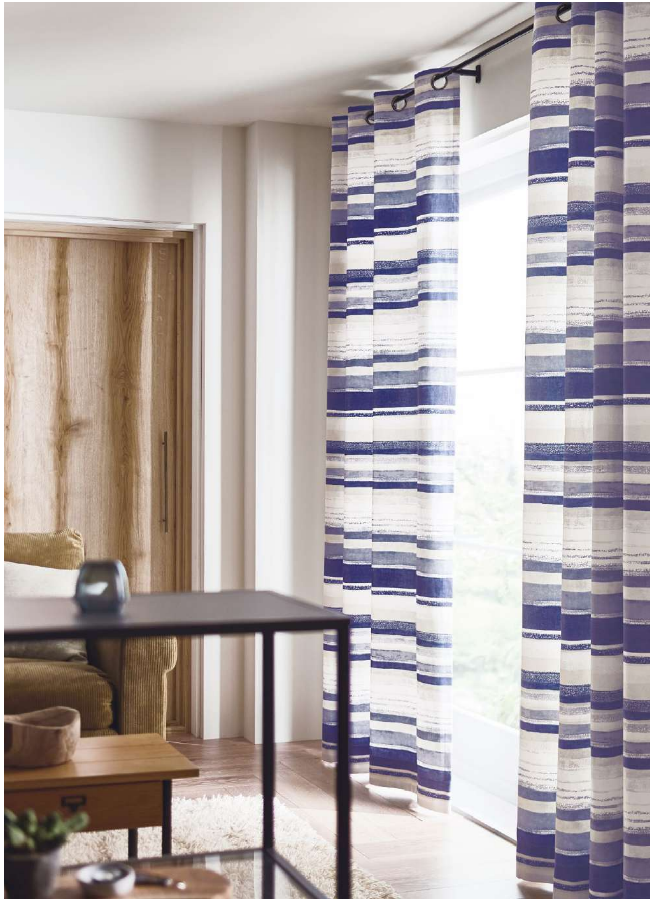
ハトメカーテン(1.5倍) : AC2060