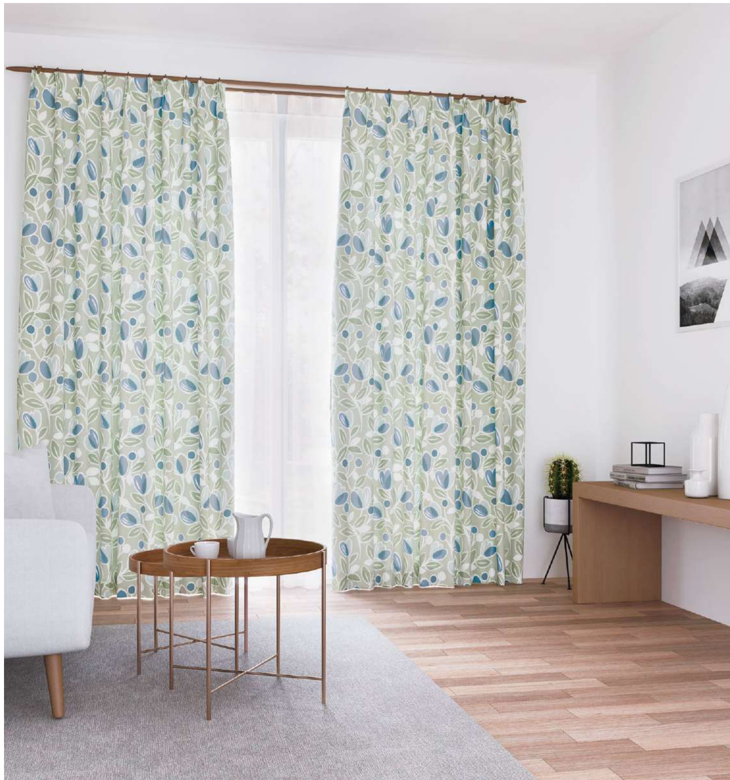
ドレープ：AC2040 シアー：AC2595 裾ウーリー(P.251)

コットンのベース生地にチューリップ柄をプリント。 かすれたタッチがこなれた空間を演出します。