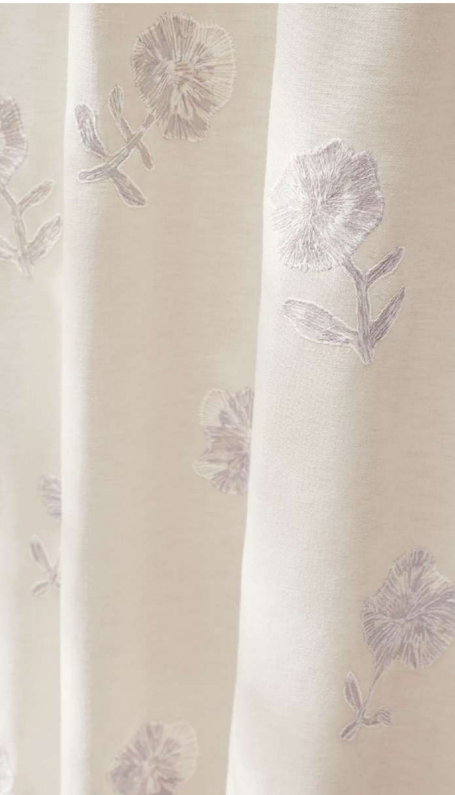
フラットカーテン(1.5倍)：AC2006

※刺繍商品のため、糸の切れ目や小さな針穴が目立つことがあります。 ※生地製の製法上、縫製時に柄が合わない場合があります。 ※生地製の製法上、表面の引きつれや糸切れにご注意ください。 ※素材の特性上、吸湿性によって生地が伸び縮みする場合があります。 ※生地製の特性上、糸の節が目立つことがあります。 ※素材の特性上、綿殻等が目立つ場合があります。 ※生地製の製法上、刺繍糸の末端が飛び出す場合があります。