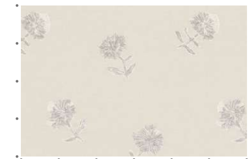
AC2006 柄は刺繍によって表現されています。