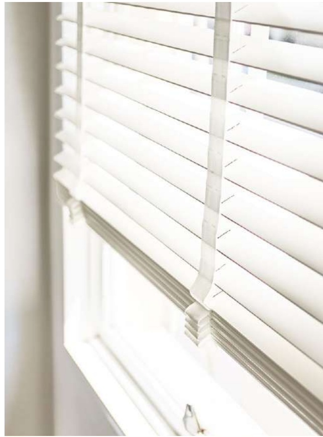
[上]ウッドブラインド: WB101 (2022 RB COLLECTION)