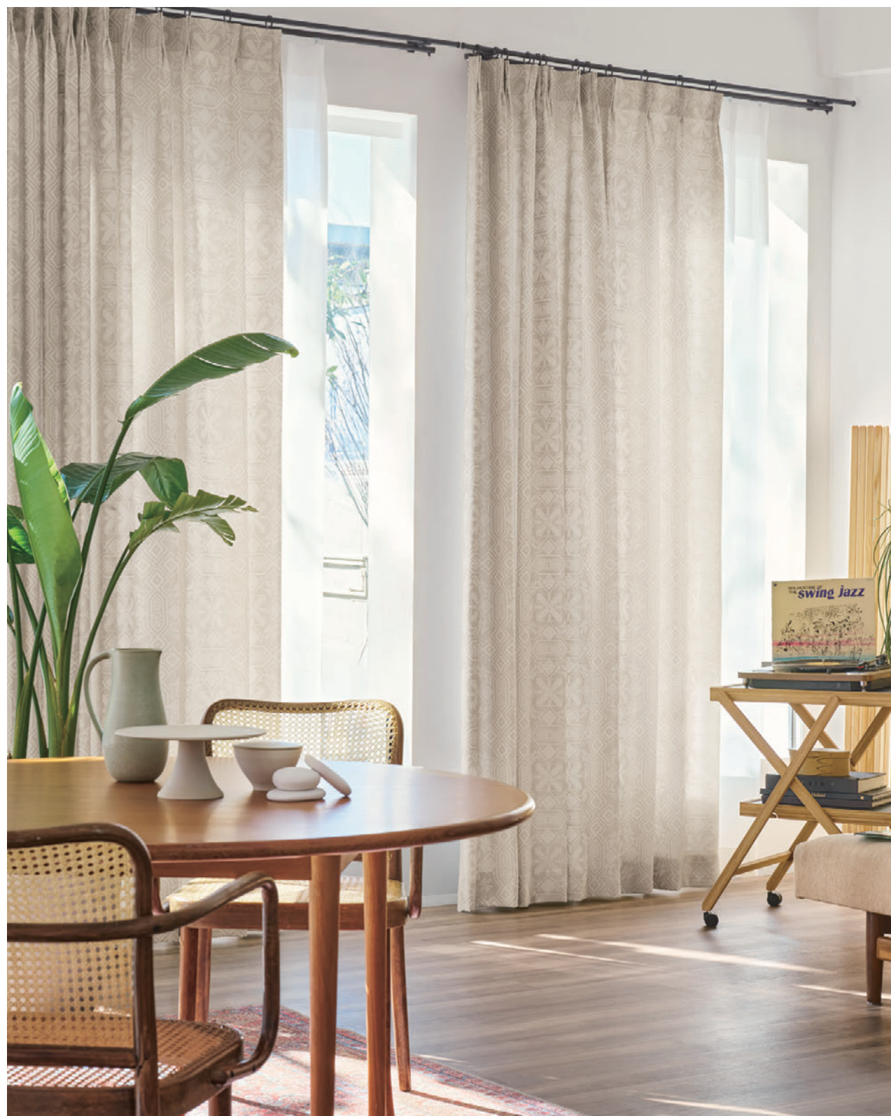
ドレープ 8148(2つ山ヒダ) レース 8567(2つ山ヒダ)