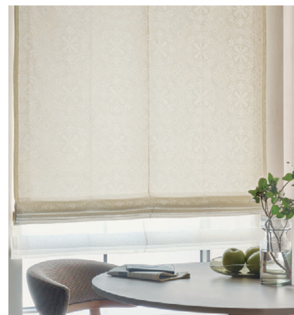
ブレースェード・ダブルシェード仕様 前 8147 後 8567