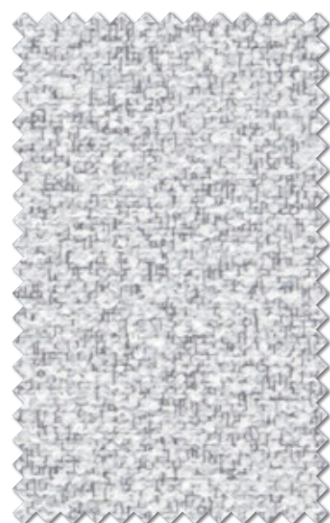
AZ-2012 NEW P.016掲載